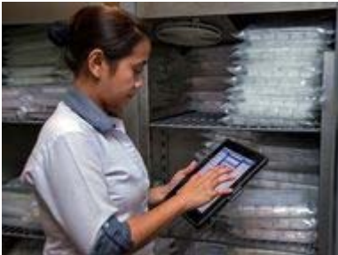
Workflow-Management mit »eMODAT«

Highlight auf dem Stand von Devacon auf der diesjährigen DMS Expo (24. bis 26. September 2013) ist das mobile Workflow-Management-System »eMODAT«, mit dem Nutzer Arbeitsabläufe via Smartphone und Tablet-PC steuern können. Vor Ort erhält Devacon Unterstützung von dem IT-Beratungsunternehmen milanconsult , einem Partner von MDM-System-Anbieter MobileIron . Hier können die Besucher die AppConnect-Technologie von MobileIron kennen lernen, die bald auch für eMODAT-User verfügbar sein soll. Das Tool konvertiert die auf den mobilen Endgeräten installierten Applikationen in sichere Container, um geschäftliche Daten vor unautorisiertem Zugriff zu schützen.